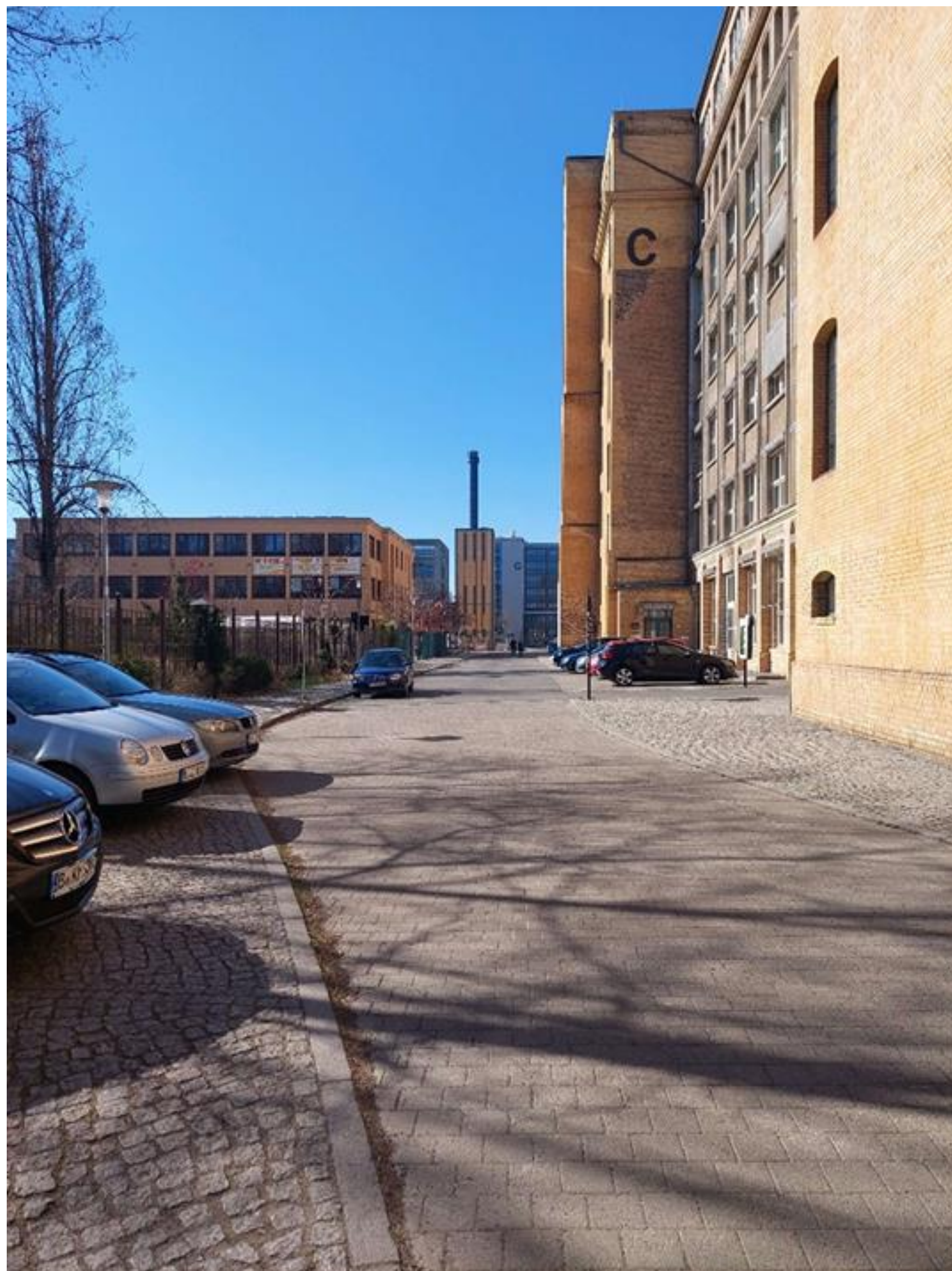
Abb. 1 Johannes-Kraatz-Straße

In Abb. 1 sieht man die aktuelle Situation der Johannes-Kraatz-Straße. Viele Student_innen beginnen hier den Studienalltag und gehen zu ihren Veranstaltungen. Nicht wirklich motivierend oder? Das Straßenbild ist geprägt von (falschparkenden) Autos, viel Beton und Pflaster. Aufgrund der schmalen Fußwege muss man regelmäßig aufpassen nicht überfahren zu werden. Des weiteren gibt es keine Möglichkeit sich dort aufzuhalten, hinzusetzen oder andere Aktivitäten wahrzunehmen. → Das wird die Freizeitmeile ändern!