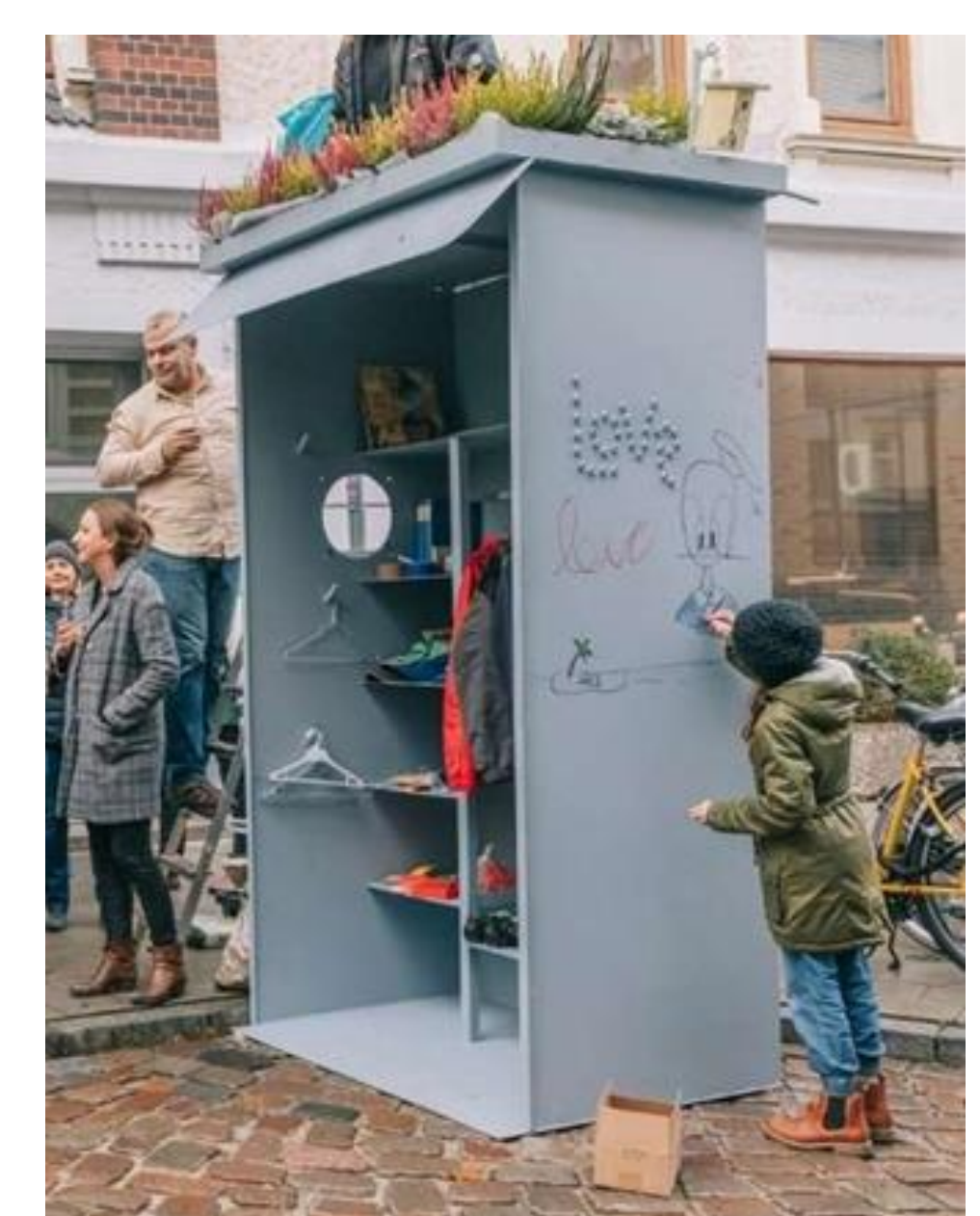
Abb. 4 Tauschbörse

Damit die Ideen umgesetzt werden, wird auf der Johannes-Kraatz-Straße ein verkehrsberuhigter Bereich entstehen. Da diese Straße eine wichtige Feuerwehrezufahrt ist, wird dieser Bereich nicht physisch von der Straße abgetrennt. Durch ein Schild und Pylonen ist es trotzdem möglich, den Bereich für Autos zu sperren und gleichzeitig die Fluchtwege freizuhalten. Fahrräder dürfen die Straße weiterhin ohne Einschränkung nutzen. Der Erfolg dieser Maßnahme ist essentiell, um Umgestaltung der Straße durchzuführen.