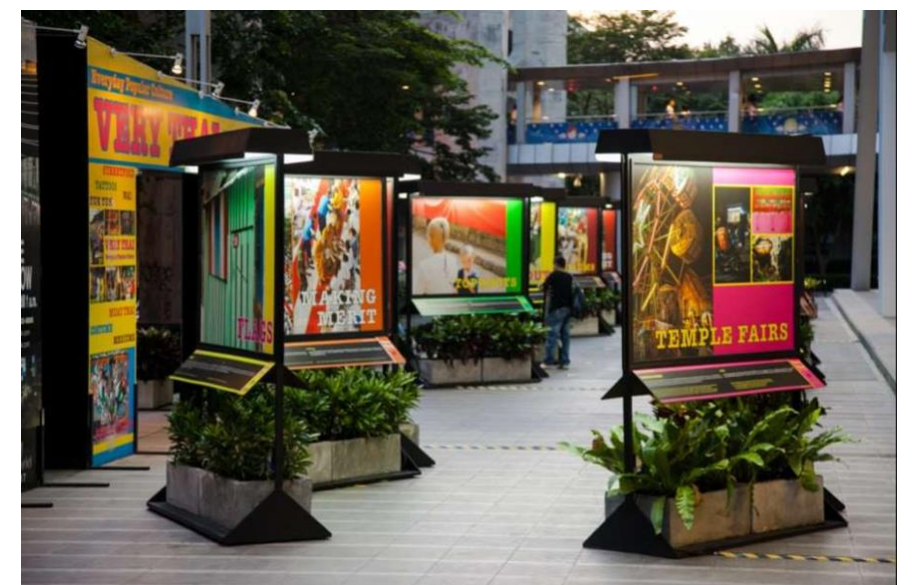
Abb. 2 Outdoor-Galerie

Die Idee einer Tauschbörse berücksichtigt ökologische und soziale Aspekte, da sie sowohl auf das Thema Nachhaltigkeit und Kreislaufwirtschaft aufmerksam macht, als auch einen Treffpunkt für die Nutzer_innen der Tauschbörse darstellt. Die Student_innen haben hier die Möglichkeit nicht mehr benötigte Artikel (z. B. Bücher, Kleidung, Geschirr) mit anderen Personen zu tauschen